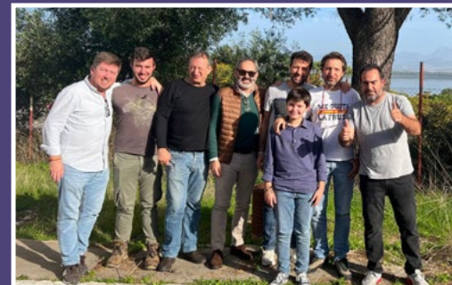
Los que no se pierden ni una. (Charanga)