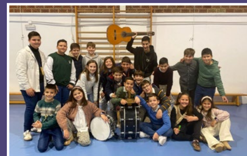
OsBornos. (Chirigota Infantil)