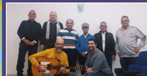
The Yuvinzes. (Chirigota)