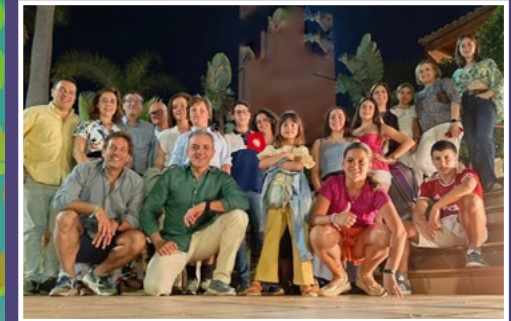
Los ABBAjaos. (Chirigota familiar)