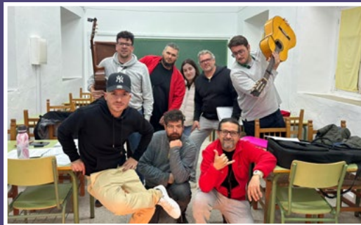
A las diez y veinte ya estoy yo en lo de Vicente. (Chirigota)