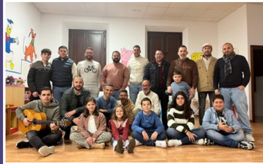
La Chirigota del Peral. (Chirigota)