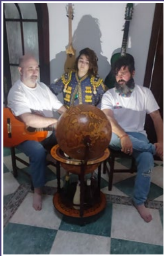
Comparsa los Correa. Entrevista con el vampiro (Comparsa)