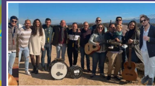
Los Piratas del Pantano. La maldición de Juan Sevillano. (Chirigota)