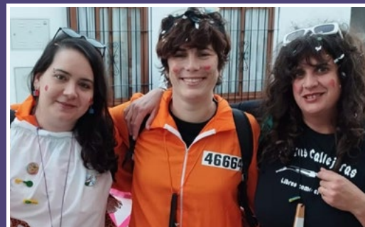
FALACIA (Formación de feministas LACIAS). (Recogía)