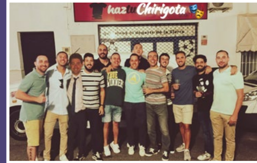
Los Tios Baranda Mamarrachos. (Chirigota)