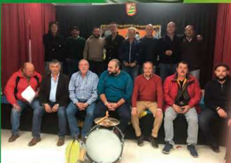
Una historia interminable Comparsa