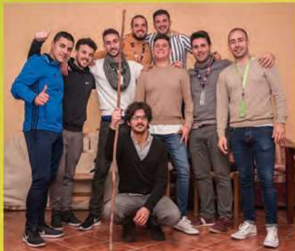
Los Lazarillos... no vea qué ciego chiquillo Chirigota