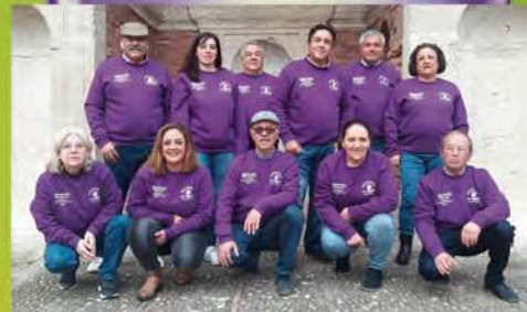
Los Maletillas La Murga de Bornos