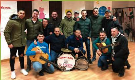
Tengo un paquete pa tí Chirigota