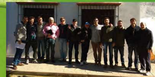
Los que se dejaron de ir Sharanga