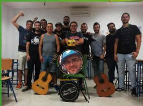
Los BO-Chevique Chirigota