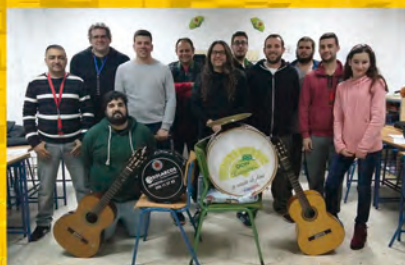
Chirigota Los que cargan con las madalenas